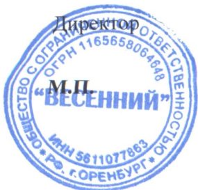
Барт Андрей Андреевич

ООО «Весенний» является собственником земельного участка, расположенным по адресу: Оренбургский район, с. Павловка, пер. Речной 1, с кадастровым номером 56:21:1802001:2510. По данным кадастровой выписки земельный участок с номером 56:21:1802001:2510 имеет вид разрешенного использования – для содержания молокоперерабатывающего завода, по данным ПЗЗ Подгородне-Покровского сельсовета участок находится в жилой зоне «Ж», просим внести изменения в ПЗЗ и поменять условные обозначения участка с жилой зоны «Ж», в промышленную зону с кодом земельного участка 6.4.