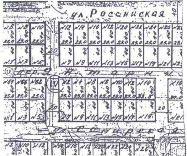
Схема размещения земельного участка