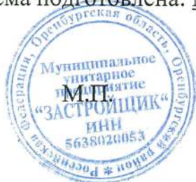
Схема подготовлена: МУП «Застройщик», начальник Резепкин Александр Иванович