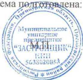
Схема подготовлена: МУП «Застройщик», начальник Резепкин Александр Иванович