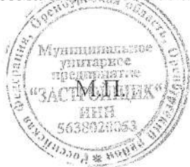
Схема подготовлена: МУП «Застройщик», начальник Резепкин Александр Иванович