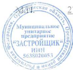
Схема подготовлена: МУП «Застройщик», начальник Резепкин Александр Иванович