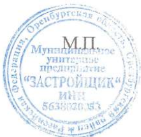
Схема подготовлена: МУП «Застройщик», и. о. начальника Литин Денис Петрович