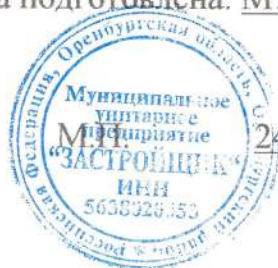
Схема подготовлена: МУП «Застройщик», начальник Резепкин Александр Иванович