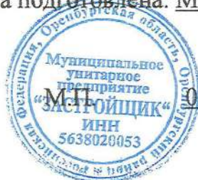
Схема подготовлена: МУП «Застройщик», начальник Резепкин Александр Иванович