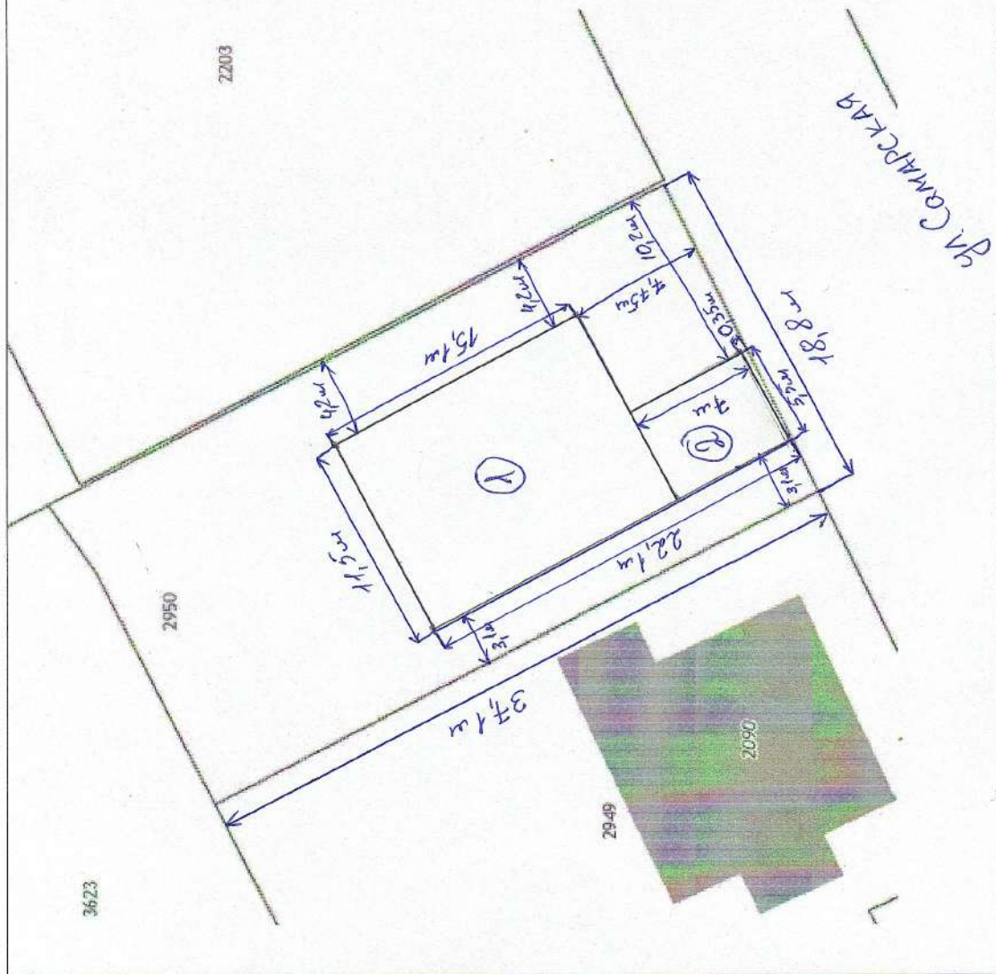
СХЕМА ПЛАНИРОВОЧНОЙ ОРГАНИЗАЦИИ ЗЕМЕЛЬНОГО УЧАСТКА С КАДАСТРОВЫМ НОМЕРОМ 56:21:1801001:2950 РАСПОЛОЖЕННОГО ПО АДРЕСУ: ОРЕНБУРГСКАЯ ОБЛАСТЬ, ОРЕНБУРГСКИЙ РАЙОН, СЕЛО ПОДГОРОДНЯЯ ПОКРОВКА, УЛИЦА САМАРСКАЯ/ПОКРОВСКАЯ. МАСШТАБ 1:350